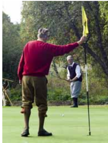
...om Leif hade sänkt den här...