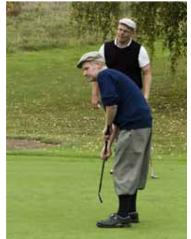
...om Scott hade hålät den här...