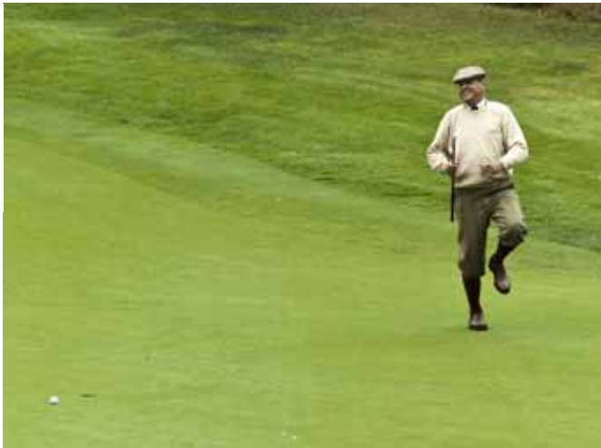
Om B-O:s boll inte hade vägrat ramla ned i hålet...